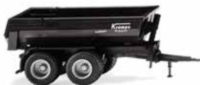
0388 19 Krampe Halfpipe Muldenkipper Ladegigant für Landwirtschaft und Baustellen