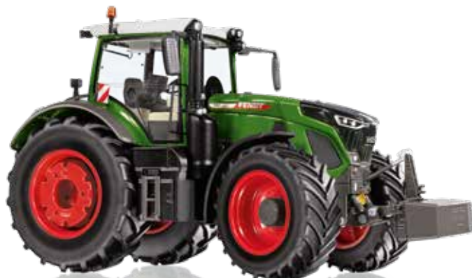
Fendt 942 Vario Einzigartige Flexibilität – Digitale Plattform