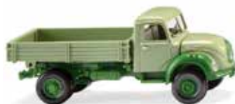
0424 96 Pritschenkipper (Magirus) Rundhauber war des Baumeisters Liebling 1957-67