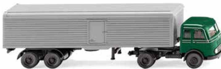
0556 01 Koffersattelzug (MB Pullman) Neuer Kofferauflieger mit WIKING-DNA 1955-63