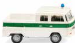
0314 05 Polizei – VW T2 Doppelkabine Doka im Dienste der Bereitschaftspolizei 1967-71