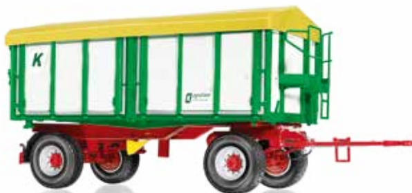
Kröger Zweiachs-Dreiseitenkipphanhänger HKD 302 Für ein wirtschaftliches und flexibles Transportgespann