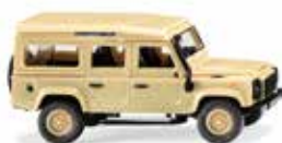
0102 04 Land Rover Defender 110 Off-Roader-Traditionalist mit Tropendach