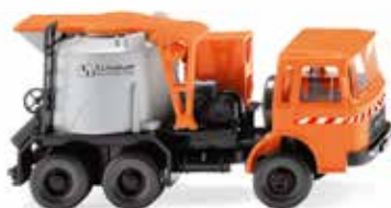
0689 04 Kommunal – Gussasphaltkocher (MAN) Modellpremiere für Baureihe F7/F8 1967-72