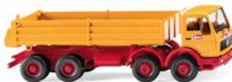
0674 05 Pritschenkipper (MB NG) Böllings vierachsiger Baustellenkipper 1973-88