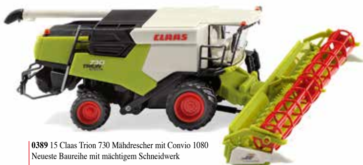
0389 15 Claas Trion 730 Mähdrescher mit Convio 1080 Neueste Baureihe mit mächtigem Schneidwerk