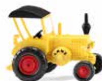
0880 10 Lanz Bulldog mit Dach Mannheimer Landmaschinen-Legende 1936-54