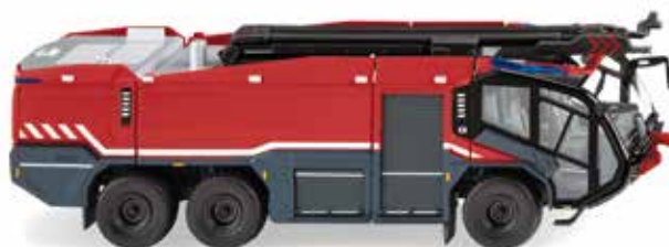
0626 47 Feuerwehr – Rosenbauer FLF Panther 6x6 Flugfeld-Gigant mit beweglichem Löscharm