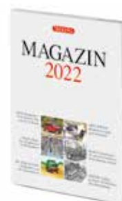
0006 29 WIKING-MAGAZIN 2022 Die exklusive Markenlektüre für WIKING-Freunde