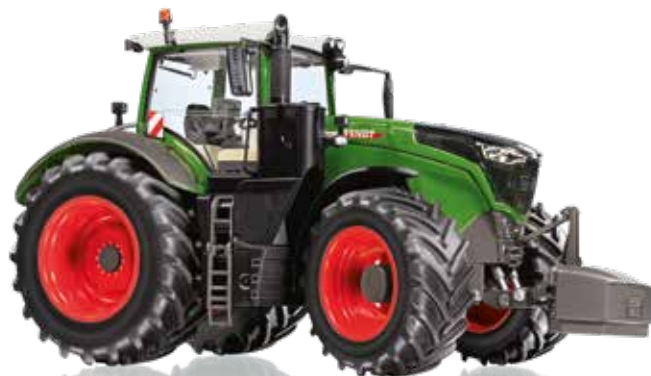
Fendt 1050 Vario Zugkraft vereint mit Intelligenz