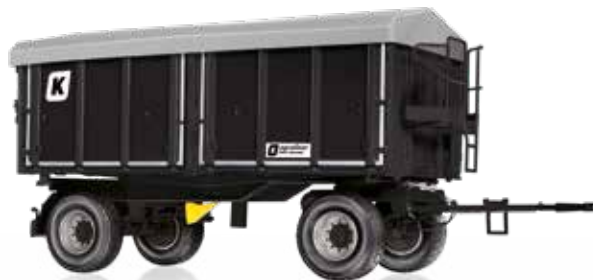
Kröger Zweiachs-Dreiseitenkipphanhänger HKD 302 Für ein wirtschaftliches und flexibles Transportgespann