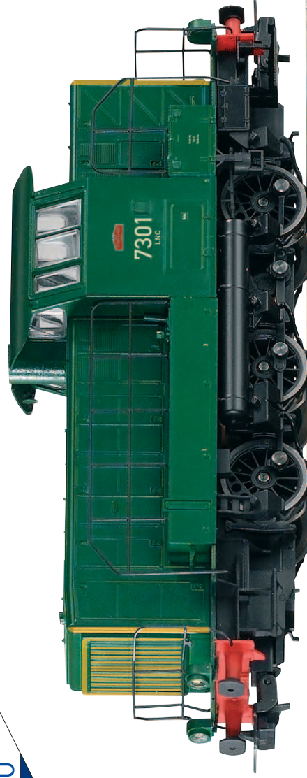
96444 Diesellok RH 7301 SNCB Ep. IV 96445 Diesellok / Soundlok RH 7301 SNCB Ep. IV